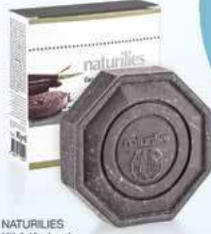
NATURILIES Kil & Karbonlu Sabun 90 gr - 27565