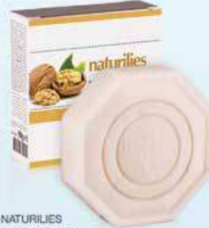
NATURILIES Ceviz sabunu 90 gr - 27766