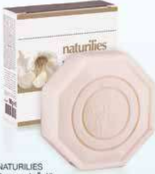
NATURILIES Sarımsak Özlü Sabun 90 gr - 27647