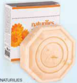
NATURILIES Naturilies Aynısafa D Vitamin Sabunu 90 gr - 27568