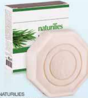
NATURILIES Çay Ağacı sabunu 90 gr - 27621