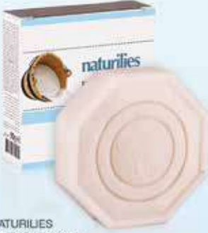
NATURILIES Keçi sütü sabun 90 gr - 27787